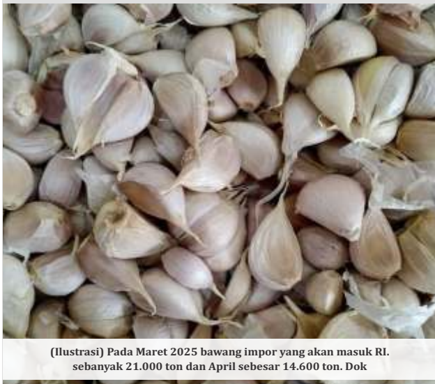
(Ilustrasi) Pada Maret 2025 bawang impor yang akan masuk RI. sebanyak 21.000 ton dan April sebesar 14.600 ton. Dok

JAKARTA - Kementerian Perdagangan (Kemendag) mengakui akan masuk impor bawang putih sebesar 35.600 ton. Pada Maret 2025 sebanyak 21.000 ton dan April sebesar 14.600 ton.