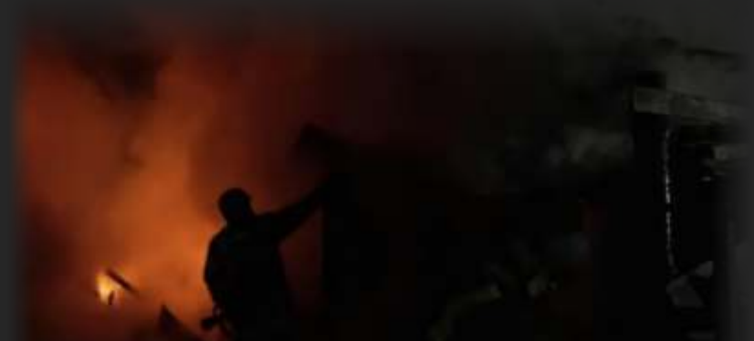
Foto selebaran yang diambil oleh Layanan Darurat Negara Ukraina dan dirilis pada Minggu (23/2/2025) ini, menunjukkan petugas pemadam kebakaran bekerja untuk memadamkan api di lokasi setelah serangan drone besar-besaran, di Kyiv, di tengah invasi Rusia ke Ukraina

Dalam upaya mencegat serangan Rusia setiap harinya, Ukraina selama konflik berkecamuk berusaha mengganggu logistik Moskow, terutama dengan secara langsung