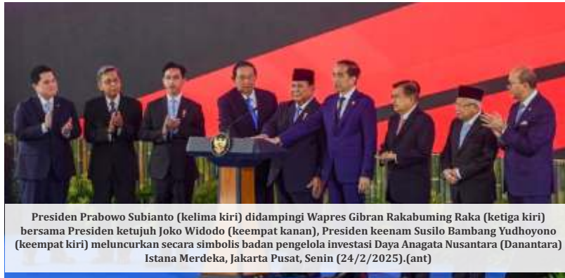
Presiden Prabowo Subianto (kelima kiri) didampingi Wapres Gibran Rakabuming Raka (ketiga kiri) bersama Presiden ketujuh Joko Widodo (keempat kanan), Presiden keenam Susilo Bambang Yudhoyono (keempat kiri) meluncurkan secara simbolis badan pengelola investasi Daya Anagata Nusantara (Danantara) Istana Merdeka, Jakarta Pusat, Senin (24/2/2025).