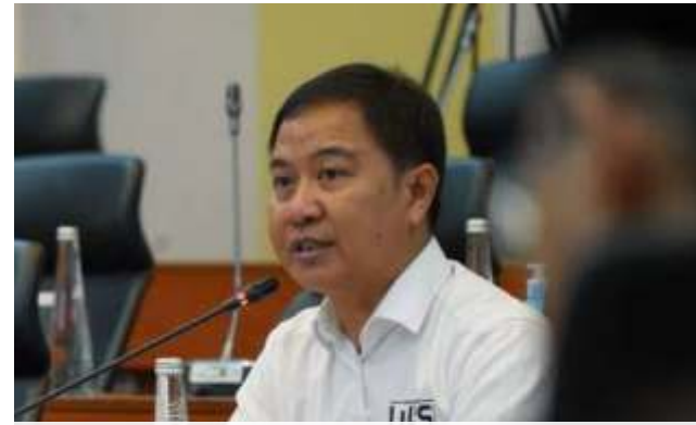
Dirjen Penyelenggaraan Haji dan Umrah Hilman Latief.

Hilman lantaran pengadaan jasa penerbangan haji dengan mekanisme kontrak tahunan menghadapi tantangan yang cukup signifikan. "Fluktuasi harga bahan bakar dan nilai tukar mata uang menyebabkan biaya penerbangan menjadi sangat dinamis," ungkapnya.