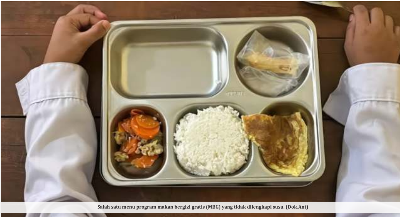
Salah satu menu program makan bergizi gratis (MBG) yang tidak dilengkapi susu.

insyaallah sudah bisa melayani lebih dari 2 juta penerima manfaat," imbuhnya.