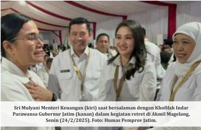
Sri Mulyani Menteri Keuangan (kiri) saat bersalaman dengan Khofifah Indar Parawansa Gubernur Jatim (kanan) dalam kegiatan retreat di Akmil Magelang, Senin (24/2/2025).

MAGELANG- Gubernur Jawa Timur Khofifah Indar Parawansa bakal menerapkan strategi innovative financing di tengah kebijakan Instruksi Presiden (Inpres) No.1 Tahun 2025 tentang efisiensi APBN/APBD.