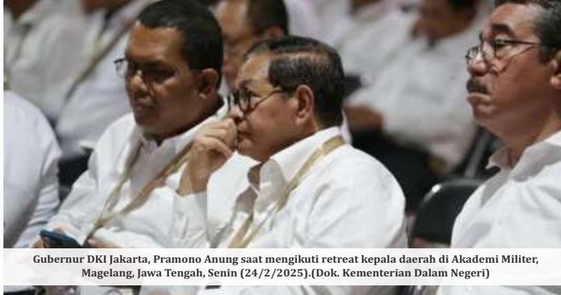
Gubernur DKI Jakarta, Pramono Anung saat mengikuti retreat kepala daerah di Akademi Militer, Magelang, Jawa Tengah, Senin (24/2/2025).

Menteri Dalam Negeri Tito Karnavian memastikan kepala daerah peserta retreat di Akmil Magelang, Jawa