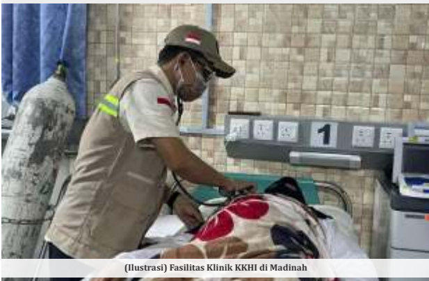
(Ilustrasi) Fasilitas Klinik KKHI di Madinah

KETUA Tim Pengawas (Timwas) Haji DPR RI 2026, Cucun Ahmad Syamsurijal, kuga menyoroti persoalan distribusi obat sekaligus penguatan layanan kesehatan bagi jemaah haji Indonesia saat melakukan peninjauan di Snood Mawteen Hotel, Kamis (21/5/2026).