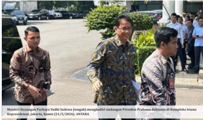
Menteri Keuangan Purbaya Yudhi Sadewa (tengah) menghadiri undangan Presiden Prabowo Subianto di Kompleks Istana Kepresidenan, Jakarta, Kamis (21/5/2026).

Purbaya menegaskan praktik underinvoicing semacam ini sebenarnya sudah berlangsung bertahun-tahun, tetapi sulit dibongkar karena keterbatasan akses data antarnegara. Kini, pemerintah mulai memanfaatkan teknologi artificial