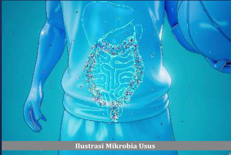
Ilustrasi Mikrobia Usus

Penelitian ini melibatkan analisis metilasi DNA (salah satu bentuk perubahan epigenetik) dari sampel darah tali pusat 571 bayi, yang kemudian dikombinasikan dengan data mikrobioma usus 969 bayi pada usia 2, 6, dan 12 bulan. Perkembangan perilaku anak kemudian dievaluasi saat mereka berusia 3 tahun menggunakan kuesioner khusus.