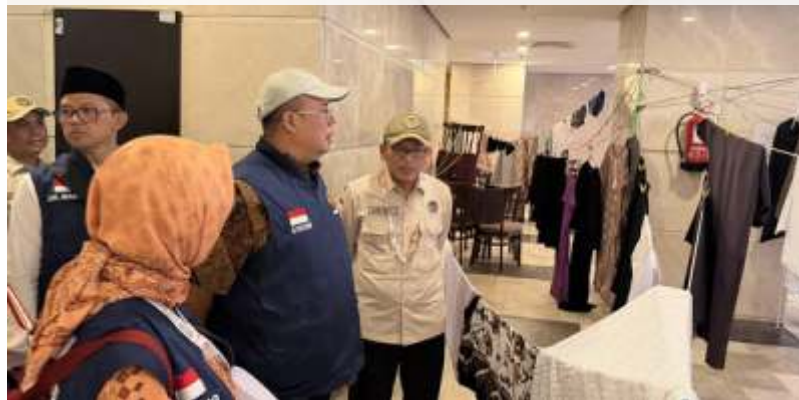
Timwas Haji DPR sidak hotel Hotel Al Hidayah Tower di Makkah, Arab Saudi, Rabu (20/5/2026).

periode 2024–2025 berhasil diturunkan sebesar Rp4 juta. Sementara untuk musim haji 2026, biaya kembali dipangkas Rp2 juta. Dengan demikian, total penurunan biaya haji dalam dua