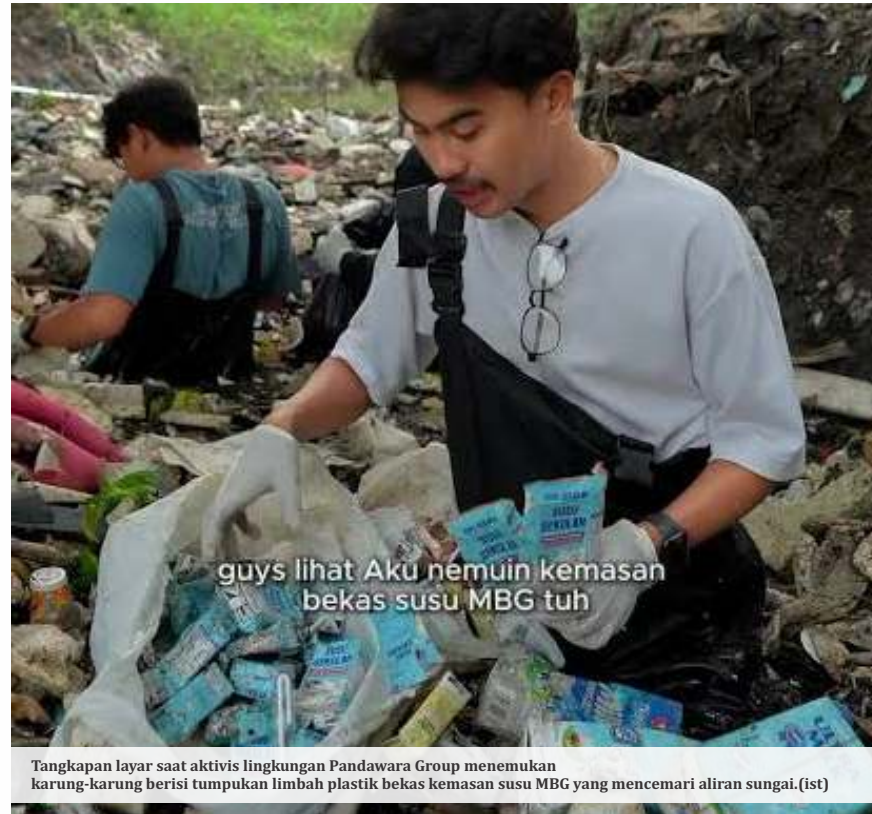
guys lihat Aku nemuin kemasan bekas susu MBG tuh

Organisasi profesi dokter anak itu juga menegaskan, “Formula adalah