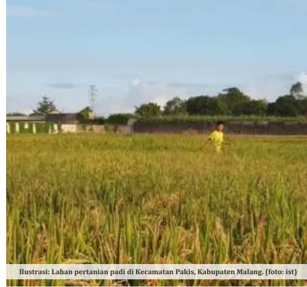
Ilustrasi: Lahan pertanian padi di Kecamatan Pakis, Kabupaten Malang.