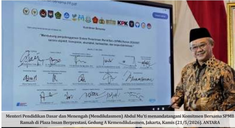
Menteri Pendidikan Dasar dan Menengah (Mendikdasmen) Abdul Mu'ti menandatangani Komitmen Bersama SPMB Ramah di Plaza Insan Berprestasi, Gedung A Kemendikdasmen, Jakarta, Kamis (21/5/2026).

Kemendikdasmen melalui Permendikdasmen Nomor 3 Tahun 2025 tentang Sistem Penerimaan Murid Baru turut memperbarui aturan batas usia masuk SD. Dalam aturan baru tersebut, anak di bawah