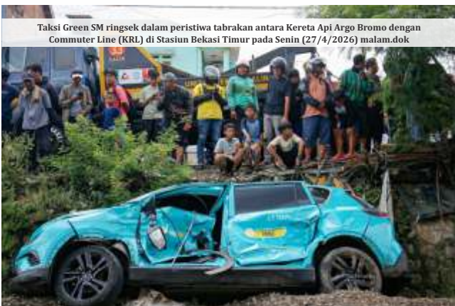
Taksi Green SM ringsek dalam peristiwa tabrakan antara Kereta Api Argo Bromo dengan Commuter Line (KRL) di Stasiun Bekasi Timur pada Senin (27/4/2026) malam.dok

Ketua KNKT Soerjanto Tjahjono mengatakan temuan itu diperoleh dari pemeriksaan data onboard unit taksi listrik bernomor polisi B 2864 SBX. “Data onboard unit kendaraan B 2864 SBX tidak terdapat rekaman yang mendeteksi error pada sistem berdasarkan data satu jam sebelum kejadian,” kata Soerjanto. (wid,rla,ant/dya)