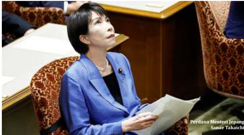
Perdana Menteri Jepang Sanae Takaichi

Melalui perubahan tersebut, Jepang membuka peluang untuk mengekspor berbagai peralatan pertahanan, mulai dari rudal hingga kapal perang, kepada negara-negara mitra. "Dengan amandemen ini, transfer seluruh peralatan pertahanan pada prinsipnya menjadi mungkin," ujar Takaichi.