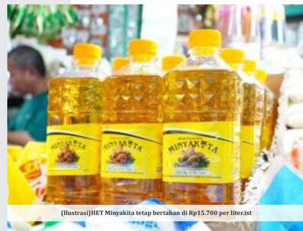
(Ilustrasi) HET Minyakita tetap bertahan di Rp15.700 per literis