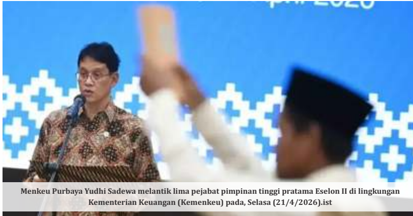
Menkeu Purbaya Yudhi Sadewa melantik lima pejabat pimpinan tinggi pratama Eselon II di lingkungan Kementerian Keuangan (Kemenkeu) pada, Selasa (21/4/2026).

“Saya bilang sama dia sekarang saya belum butuh karena saya sendiri punya persediaan hampir US$ 25 miliar untuk negara kita sendiri, jadi aman,” kata Purbaya di Gedung Juanda I Kementerian Keuangan, Jakarta, Selasa (21/4/2026).