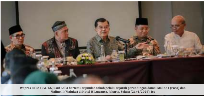
Wapres RI ke 10 & 12, Jusuf Kalla bertemu sejumlah tokoh pelaku sejarah perundingan damai Malino I (Poso) dan Malino II (Maluku) di Hotel JS Luwansa, Jakarta, Selasa (21/4/2026).