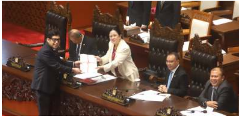
Menteri Hukum Supratman Andi Agtas menyerahkan draft RUU PPRT kepada Ketua DPR RI Puan Maharani disaksikan pimpinan DPR RI lainnya dalam Rapat Paripurna DPR RI di Jakarta, Selasa (21/4/2026).

R ancangan Undang-Undang Pelindungan Pekerja Rumah Tangga atau PPRT akhirnya disahkan oleh DPR menjadi undang-undang (UU). Dalam salah satu pasal