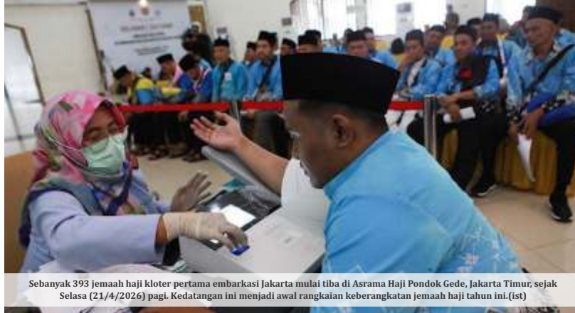
Sebanyak 393 jemaah haji kloter pertama embarkasi Jakarta mulai tiba di Asrama Haji Pondok Gede, Jakarta Timur, sejak Selasa (21/4/2026) pagi. Kedatangan ini menjadi awal rangkaian keberangkatan jemaah haji tahun ini.