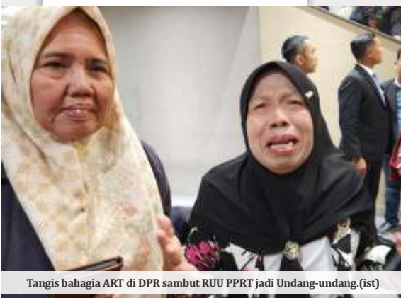
Tangis bahagia ART di DPR sambut RUU PPRT jadi Undang-undang. (ist)

Menurutnya, pekerja rumah tangga layak dipandang sebagai "Kartini-Kartini" masa kini yang selama ini bekerja tanpa perlindungan hukum yang memadai. (tin,ist/dya)