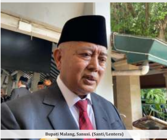
Bupati Malang, Sanusi.

MALANG - Bupati Malang, Sanusi, memberikan peringatan keras kepada seluruh kepala sekolah tingkat SD hingga SMP di wilayahnya, untuk menghentikan praktik penarikan iuran di luar ketentuan. Larangan ini ditegaskan sebagai upaya memberantas praktik pungutan liar (pungli) di sektor pendidikan.