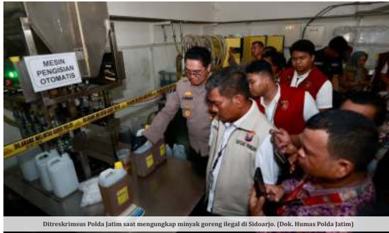
Ditreskrimsus Polda Jatim saat mengungkap minyak goreng ilegal di Sidoarjo.

K epolisian membongkar praktik kecurangan pengemasan minyak goreng bersubsidi, Minyakita, yang volumenya tidak sesuai dengan label pada kemasan di sebuah gudang di Taman, Sidoarjo, Jawa Timur. Dalam