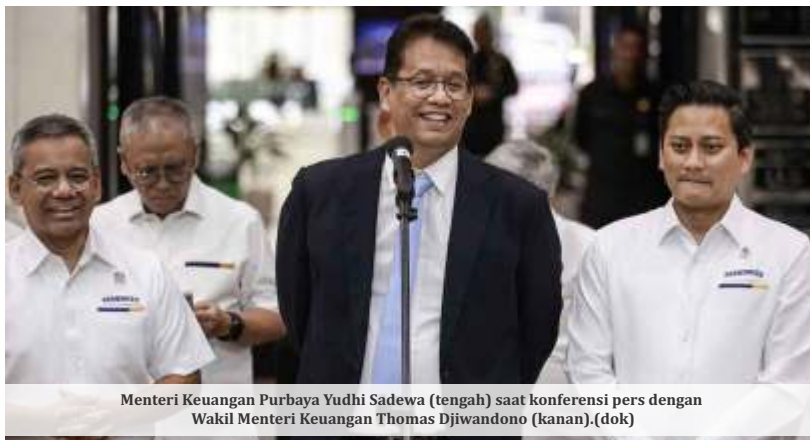
Menteri Keuangan Purbaya Yudhi Sadewa (tengah) saat konferensi pers dengan Wakil Menteri Keuangan Thomas Djiwandono (kanan).

K epastian ini disampaikan langsung Menteri Sekretaris Negara (Mensesneg) Prasetyo Hadi. "Ada beberapa nama yang dikirimkan, salah satunya memang betul ada nama yang kita usulkan adalah Pak Wamenkeu atas nama Pak Tommy Djiwandono," ujar Prasetyo di Kompleks Istana Kepresidenan, Jakarta, Senin (19/1/2026).