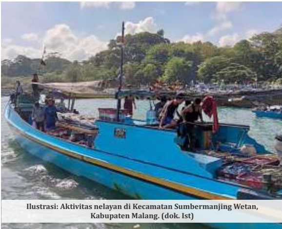
Ilustrasi: Aktivitas nelayan di Kecamatan Sumbermanjing Wetan, Kabupaten Malang.

MALANG - Pemerintah Kabupaten (Pemkab) Malang membidik produksi tangkapan ikan laut pada tahun 2026 mencapai 29,7 ribu ton. Angka tersebut meningkat dibandingkan realisasi sepanjang 2025 yang tercatat sebesar 28,4 ribu ton.