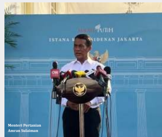
Menteri Pertanian Amran Sulaiman

Menurut dia, pemerintah bergerak cepat dengan mengumpulkan ratusan pelaku usaha sawit dari berbagai daerah untuk mencari akar persoalan. Pertemuan tersebut melibatkan