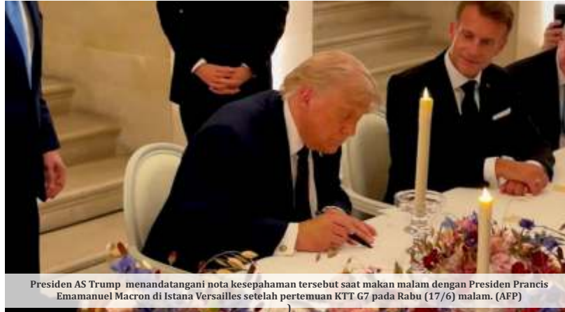
Presiden AS Trump menandatangani nota kesepahaman tersebut saat makan malam dengan Presiden Prancis Emmanuel Macron di Istana Versailles setelah pertemuan KTT G7 pada Rabu (17/6) malam.

Nota kesepahaman (MoU) yang diteken Presiden Amerika Serikat Donald Trump dan Iran untuk mengakhiri perang di Timur Tengah justru memicu gelombang kritik di dalam negeri AS. Sejumlah media besar, termasuk yang selama ini cenderung mendukung Trump, menilai kesepakatan tersebut memberi keuntungan terlalu besar kepada Teheran tanpa memperoleh imbalan yang sepadan.