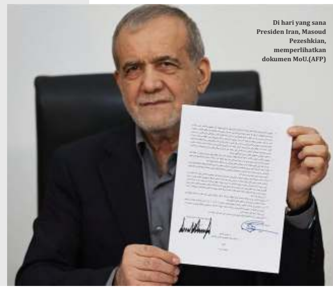
Di hari yang sama Presiden Iran, Masoud Pezeshkian, memperlihatkan dokumen MoU.

Ketiga kapal tersebut sebelumnya mematikan sistem identifikasi saat konflik berlangsung. Selama penutupan jalur pelayaran, Arab Saudi lebih banyak mengandalkan pelabuhan Yanbu di Laut Merah untuk mengekspor minyaknya. (wid,ist/dya)