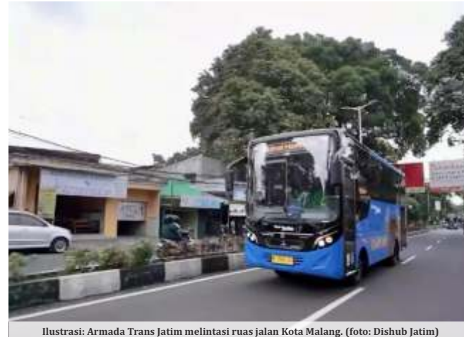
Ilustrasi: Armada Trans Jatim melintasi ruas jalan Kota Malang.

Ditambahkannya, tiga usulan rute dari Pemerintah Kabupaten Malang masih akan dikaji lebih lanjut sebelum ditetapkan sebagai jalur operasional. Penilaian dilakukan dengan mempertimbangkan