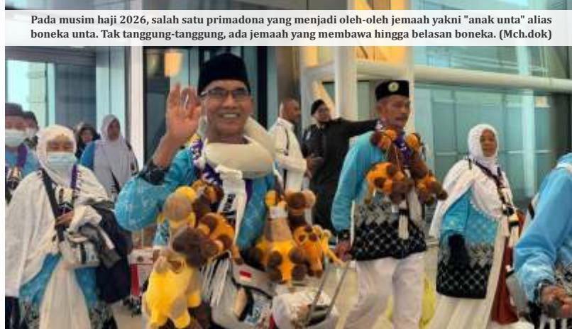
Pada musim haji 2026, salah satu primadona yang menjadi oleh-oleh jemaah yakni "anak unta" alias boneka unta. Tak tanggung-tanggung, ada jemaah yang membawa hingga belasan boneka. (Mch.dok)

Dalam keterangan yang tercantum di laman SIPP, perkara tersebut