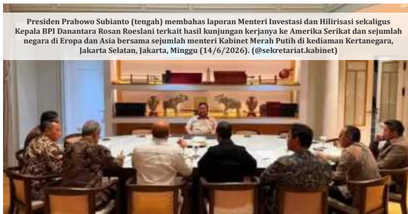
Presiden Prabowo Subianto (tengah) membahas laporan Menteri Investasi dan Hilirisasi sekaligus Kepala BPI Danantara Rosan Roeslani terkait hasil kunjungan kerjanya ke Amerika Serikat dan sejumlah negara di Eropa dan Asia bersama sejumlah menteri Kabinet Merah Putih di kediaman Kertanegara, Jakarta Selatan, Jakarta, Minggu (14/6/2026).

Rapat itu turut dihadiri Menteri Energi dan Sumber Daya Mineral (ESDM) Bahlil Lahadalia, Menteri Keuangan Purbaya Yudhi Sadewa, Menteri Pendidikan Tinggi, Sains, dan Teknologi Brian Yulianto, COO