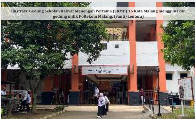
Ilustrasi: Gedung Sekolah Rakyat Menengah Pertama (SRMP) 16 Kota Malang menggunakan gedung milik Poltekcom Malang.