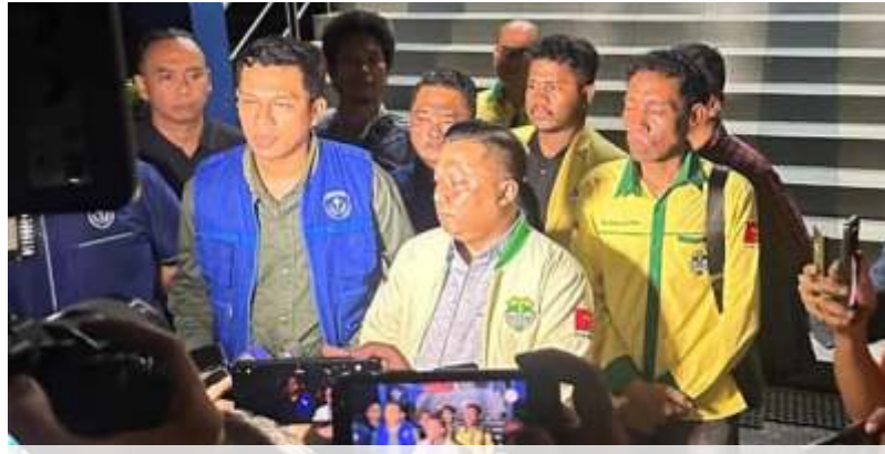
Wakil Presiden ke-10 dan ke-12 RI, Jusuf Kalla (JK) dilaporkan ke Polda Metro Jaya atas pidato di UGM.

"Dalam ajaran Kristiani, kasih adalah hukum yang utama. Iman kami tidak mengajarkan kekerasan sebagai