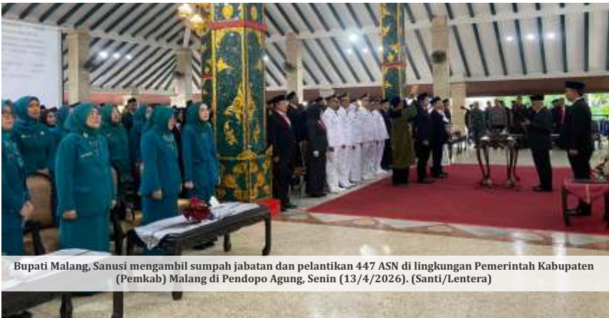
Bupati Malang, Sanusi mengambil sumpah jabatan dan pelantikan 447 ASN di lingkungan Pemerintah Kabupaten (Pemkab) Malang di Pendopo Agung, Senin (13/4/2026).

MALANG- Bupati Malang, Sanusi, membantah praktik jual beli jabatan dalam mutasi dan pelantikan 447 aparatur sipil negara (ASN) di lingkungan Pemerintah Kabupaten (Pemkab) Malang. Sanusi memper-silakan pihak mana pun untuk melapor jika ada temuan indikasi praktik tersebut.