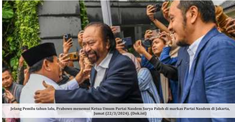
Jelang Pemilu tahun lalu, Prabowo menemui Ketua Umum Partai Nasdem Surya Paloh di markas Partai Nasdem di Jakarta, Jumat (22/3/2024).

Candaan itu berlanjut ketika ia menyinggung kursi kosong di antara keduanya sebagai simbol