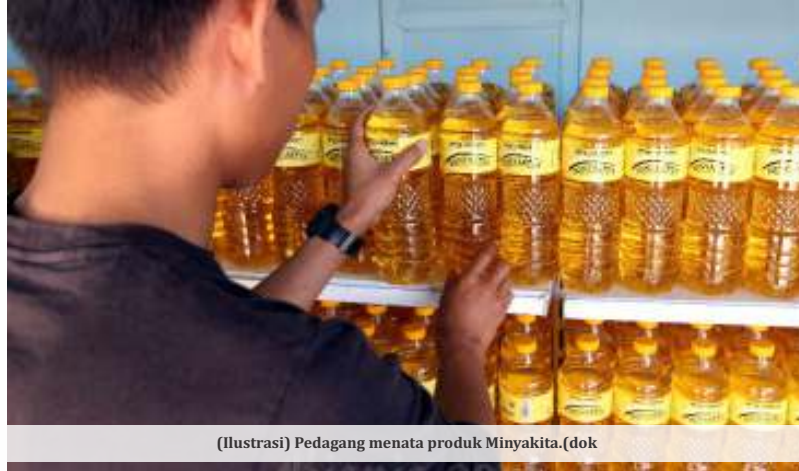
(Ilustrasi) Pedagang menata produk Minyakita.(dok

D irektur Utama Perum Bulog, Ahmad Rizal Ramdhani mengakui ketersediaan minyak goreng rakyat merek