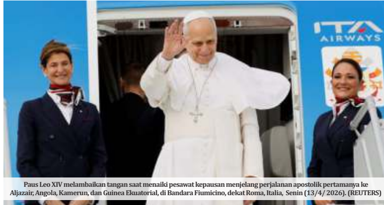
Paus Leo XIV melambaikan tangan saat menaiki pesawat kepausan menjelang perjalanan apostolik pertamanya ke Aljazair, Angola, Kamerun, dan Guinea Ekuatorial, di Bandara Fiumicino, dekat Roma, Italia, Senin (13/4/2026).

Walaupun Paus tidak menyebut nama secara spesifik, publik menangkap sinyal bahwa teguran itu ditujukan kepada Trump dan jajaran pejabat AS lainnya yang selama ini sering memamerkan kekuatan militer serta menggunakan narasi agama