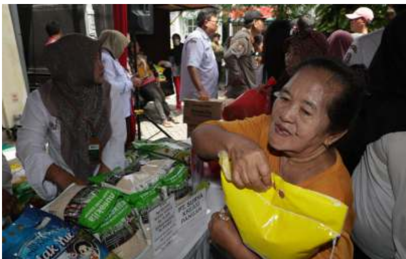
Sejumlah warga antusias menyerbu Pasar Murah yang rutin digelar Pemkot Surabaya.