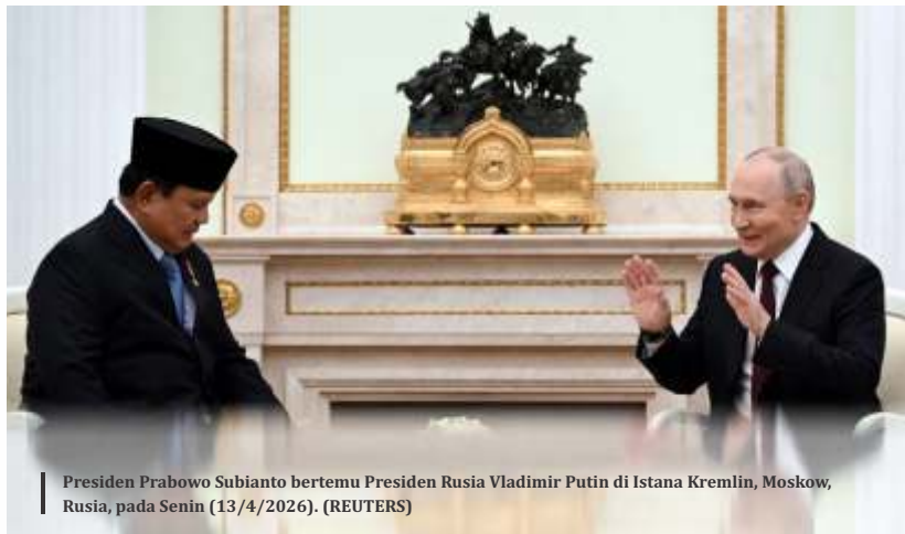
Presiden Prabowo Subianto bertemu Presiden Rusia Vladimir Putin di Istana Kremlin, Moskow, Rusia, pada Senin (13/4/2026).

Rico juga menegaskan otoritas wilayah udara nasional sepenuhnya berada pada negara Indonesia. Setiap kemungkinan pengaturan tetap berada di bawah kendali pemerintah Indonesia.