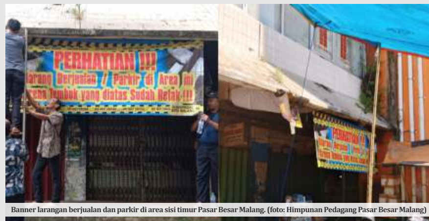
Banner larangan berjualan dan parkir di area sisi timur Pasar Besar Malang.

Lebih lanjut, ia mengajak seluruh pihak untuk mengesampingkan konflik kepentingan yang selama ini menjadi