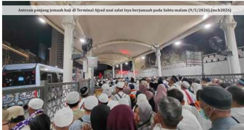
Antrean panjang jemaah haji di Terminal Ajyad usai salat Isya berjamaah pada Sabtu malam (9/5/2026).

Di tengah pelayanan tersebut, muncul keluhan dari sejumlah jemaah terkait larangan menjemur pakaian di area rooftop hotel. Menurut Suryo, aturan itu berasal dari otoritas Arab Saudi demi menjaga keselamatan