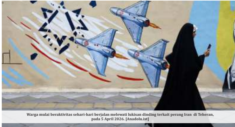
Warga mulai beraktivitas sehari-hari berjalan melewati lukisan dinding terkait perang Iran di Teheran, pada 5 April 2026.

melaporkan sejumlah ledakan terdengar di dekat Kota Bandar Abbas. Fars menyebut asal ledakan belum diketahui secara pasti, namun investigasi awal menunjukkan adanya "baku tembak" antara militer Iran dan pihak yang disebut sebagai "musuh".