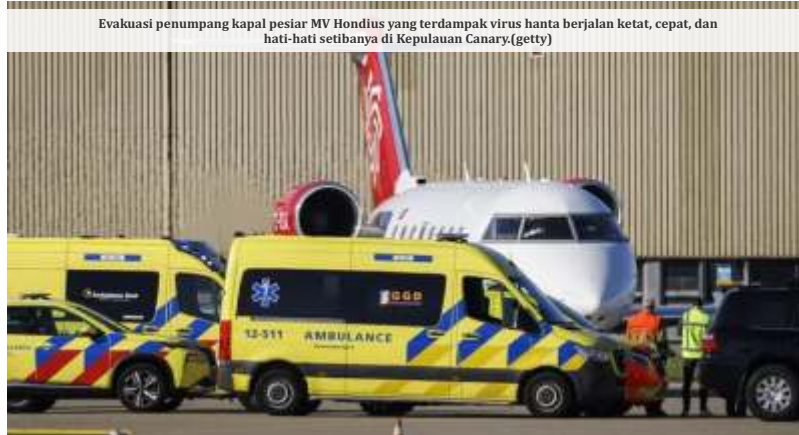
Evaluasi penumpang kapal pesiar MV Hondius yang terdampak virus hanta berjalan ketat, cepat, dan hati-hati setibanya di Kepulauan Canary.

Ia menilai Indonesia memiliki risiko cukup besar terhadap penyebaran hantavirus akibat kepadatan penduduk, buruknya sanitasi lingkungan, serta tingginya populasi tikus di kawasan permukiman. Edy juga menyebut