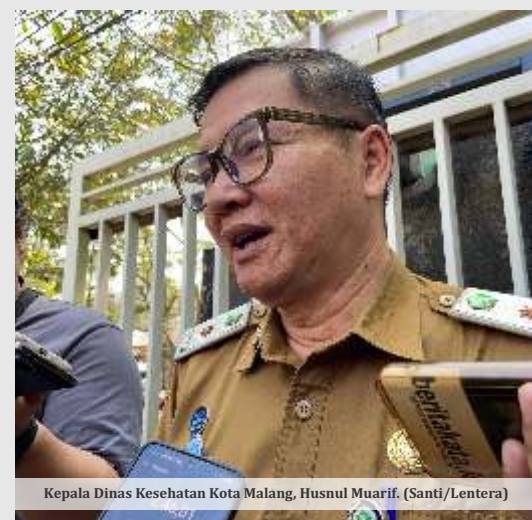
Kepala Dinas Kesehatan Kota Malang, Husnul Muarif.

2026 ini Dinkes Kota Malang mencatat tidak adanya kasus positif campak yang terjadi di 5 wilayah kecamatan. Seluruh program imunisasi massa maupun imunisasi kejar juga telah dilakukan sejak Februari hingga April 2026. (Santi/Dya)