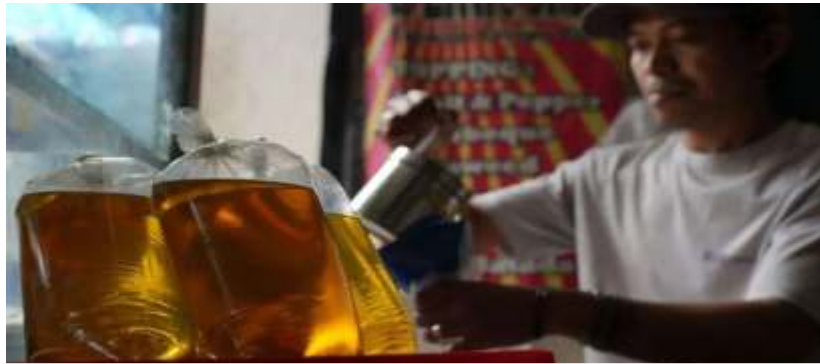
(Ilustrasi) Harga dan stok minyak goreng di pasar fluktuatif meski pemerintah menegaskan aman.

Menteri Perdagangan (Mendag) Budi Santoso membantah kabar yang menyebut minyak goreng rakyat MinyakKita mengalami kelangkaan dan lonjakan harga di pasaran. Pernyataan itu disampaikan menanggapi temuan Ombudsman RI terkait harga MinyakKita yang disebut melampaui Harga Eceran Tertinggi (HET). Sementara itu, menanggapi keluhan masyarakat, dia menyarankan agar warga beli merk lain