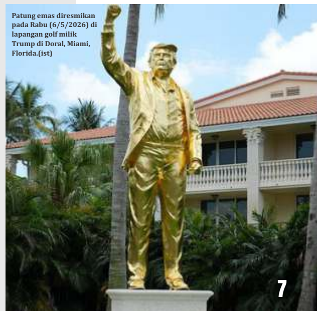
Patung emas diresmikan pada Rabu (6/5/2026) di lapangan golf milik Trump di Doral, Miami, Florida.

Instalasi patung emas menyerupai Presiden Amerika Serikat Donald Trump kembali menjadi sorotan publik. Berbeda dari sejumlah patung sebelumnya yang bernuansa sindiran politik, patung terbaru ini disebut sebagai bentuk selebrasi terhadap sosok Trump. (gus,afp, rtr/dya)