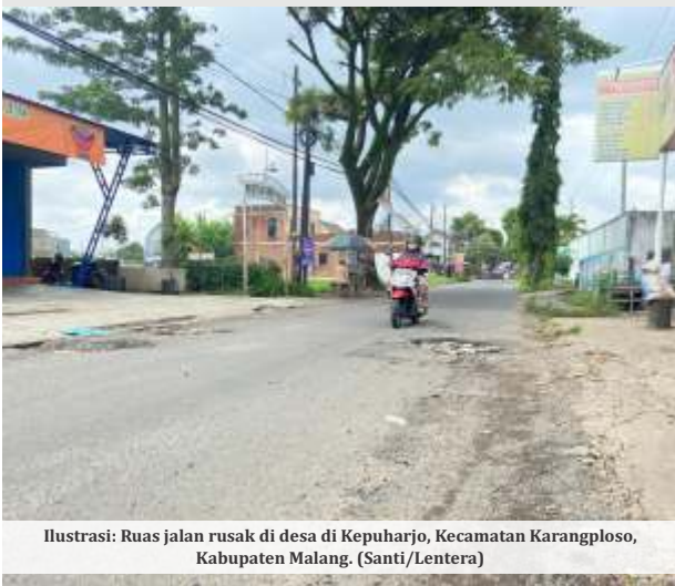
Ilustrasi: Ruas jalan rusak di desa di Kepuharjo, Kecamatan Karangploso, Kabupaten Malang.

MALANG - Pemerintah Kabupaten (Pemkab) Malang kebut program perbaikan jalan lingkungan desa pada tahun 2026. Sebanyak 125 titik jalan di 28 kecamatan dipastikan masuk dalam daftar prioritas pembangunan, dengan anggaran total sekitar Rp21 miliar.