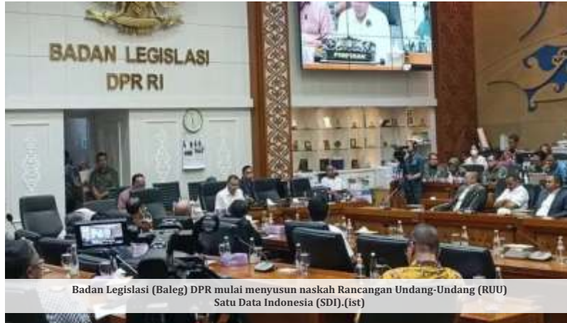
Badan Legislasi (Baleg) DPR mulai menyusun naskah Rancangan Undang-Undang (RUU) Satu Data Indonesia (SDI). (ist)

Badan Informasi Geospasial (BIG), Senin (6/4/2026). Mulanya ia mengatakan mesti ada aksesibilitas sistem informasi geospasial.