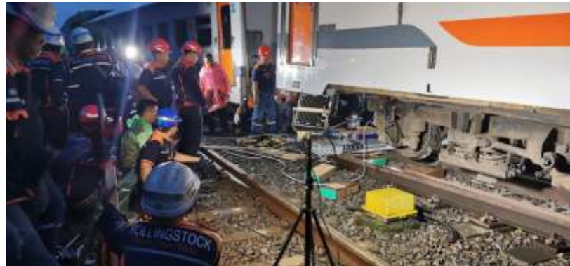
Petugas melakukan perbaikan dan penanganan KA Bangunkarta relasi Jombang-Pasarsenen yang anjlok di emplasemen Bumiayu Km 312+1, Bumiayu, Brebes, Jawa Tengah, Senin (6/4/2026).

"Upaya kami untuk penumpang apabila mengalami keterlambatan ada service recovery berupa pemberian minuman apabila kereta terlambat lebih dari 60 menit. Kemudian apabila kereta terlambat lebih dari 90 menit,