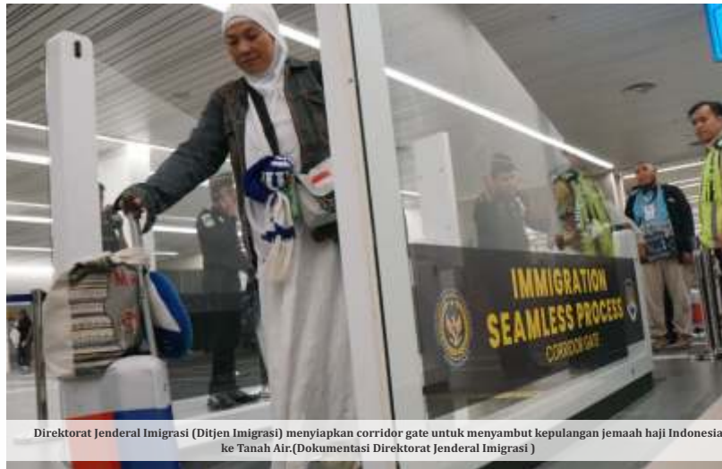
Direktorat Jenderal Imigrasi (Ditjen Imigrasi) menyiapkan corridor gate untuk menyambut kepulangan jemaah haji Indonesia ke Tanah Air.

Di tengah keputungan jemaah yang menandai berakhirnya musim haji 2026, Asosiasi Muslim Penyelenggara Haji dan Umrah Republik Indonesia (AMPHURI) langsung waswas. Pihaknya meminta pemerintah untuk mengantisipasi ketatnya regulasi baru haji 2027. Kementerian Haji dan Umrah RI bersama BPKH didesak segera menyinkronkan sistem pelunasan biaya haji domestik agar lebih awal, guna menghindari sengkabut birokrasi digital platform Nusuk Masar dan kompleksitas sistem Business to Business to Consumer (B2B2C) di Arab Saudi yang mengancam kenyamanan jemaah khusus Indonesia.