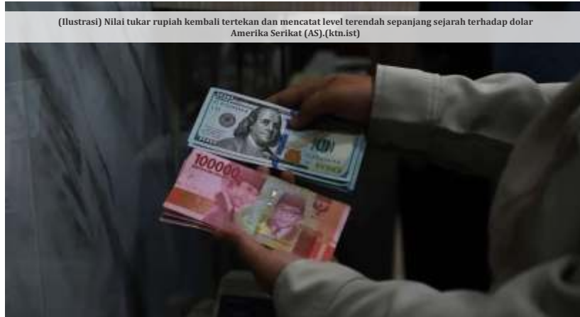
(Ilustrasi) Nilai tukar rupiah kembali tertekan dan mencatat level terendah sepanjang sejarah terhadap dolar Amerika Serikat (AS).

Berdasarkan data Refinitiv, rupiah sempat ditutup di level Rp17.940/US$. Sementara itu, data Bloomberg mencatat rupiah terperosok lebih dalam sebesar 127 poin atau 0,71 persen ke level Rp17.965/US$ dari penutupan sebelumnya di level Rp17.839/US$.