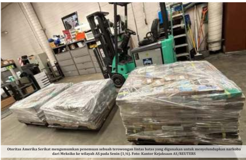
Otoritas Amerika Serikat mengumumkan penemuan sebuah terowongan lintas batas yang digunakan untuk menyelundupkan narkoba dari Meksiko ke wilayah AS pada Senin (1/6).

Minyak mentah (crude petroleum), gas alam, mobil penumpang, besi, serta aluminium. Kanada memasok hampir 60% kebutuhan minyak impor tahunan AS.