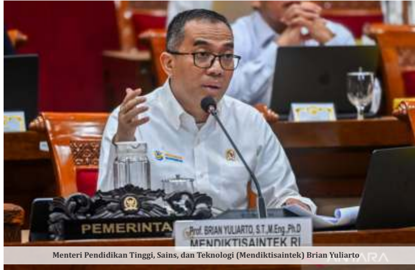
Menteri Pendidikan Tinggi, Sains, dan Teknologi (Mendikdisainstek) Brian Yulianto

"Untuk dosen PPPK, kami sudah mengkaji dan sudah bertemu juga dengan KemenPANRB. Kami juga menyampaikan, sama seperti tadi yang sudah disampaikan Ibu pimpinan, bahwa model PPPK ini tidak