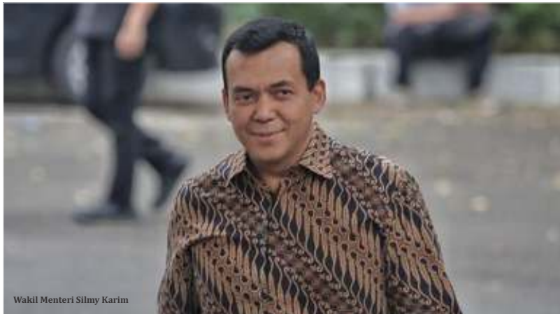
Wakil Menteri Silmy Karim

KPK mengindikasikan bahwa posisi Silmy terdeteksi tidak jauh dari pusat pemerintahan. "Informasi terakhir yang kami dapatkan, keberadaan SK (Silmy Karim) ada di Jakarta dan sekitarnya. Untuk itu kami mengimbau agar yang bersangkutan juga bisa kooperatif sehingga dapat