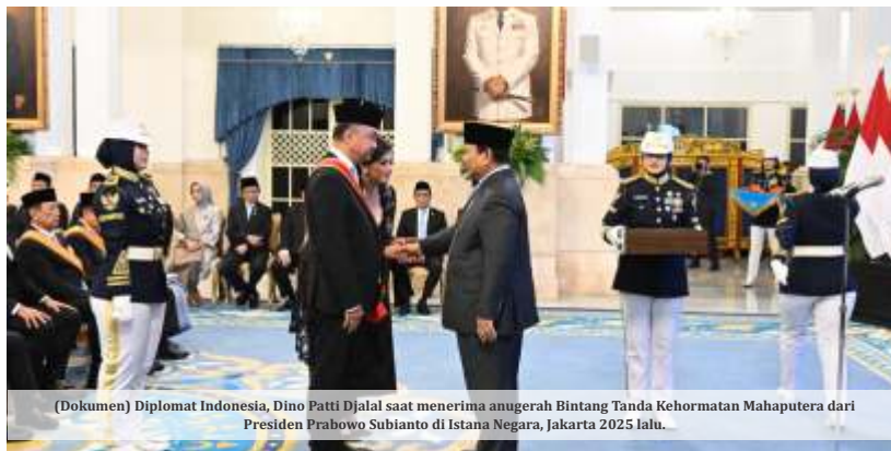
(Dokumen) Diplomat Indonesia, Dino Patti Djalal saat menerima anugerah Bintang Tanda Kehormatan Mahaputera dari Presiden Prabowo Subianto di Istana Negara, Jakarta 2025 lalu.

Dino Patti Djalal mengingatkan pentingnya menjaga keseimbangan antara diplomasi internasional dengan penanganan berbagai persoalan domestik di dalam negeri. Sementara itu, Mahfud MD menyoroti bahwa efektivitas serta hasil nyata dari rangkaian lawatan tersebut bagi masyarakat luas perlu