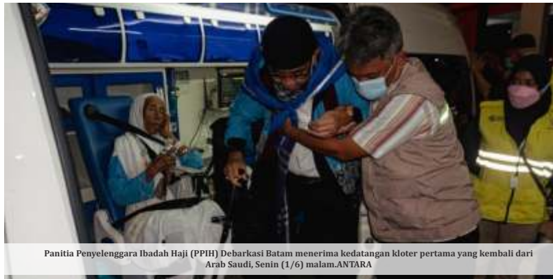
Panitia Penyelenggara Ibadah Haji (PPIH) Debaroksi Batam menerima kedatangan kloter pertama yang kembali dari Arab Saudi, Senin (1/6) malam.

Satuan Tugas (Satgas) Haji dan Umrah 2026 mencatat sebanyak 550 calon jemaah menjadi korban dugaan penipuan dan pelanggaran penyelenggaraan ibadah haji hingga akhir Mei 2026. Total kerugian masyarakat akibat kasus tersebut mencapai Rp21.701.700.000 atau sekitar Rp21,7 miliar. Berdasarkan data Subsatgas Penegakan Hukum (Gakkum) hingga 29 Mei 2026, aparat telah menangani 29 Laporan Polisi (LP) dan 30 Laporan Informasi (LI). Dari puluhan kasus tersebut, sebanyak 26 tersangka telah diproses secara hukum.