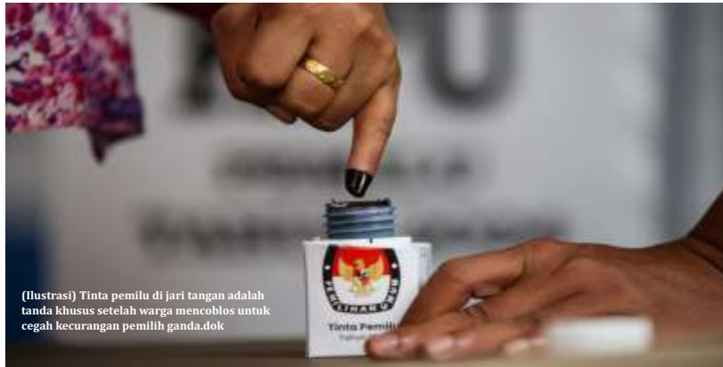
(Ilustrasi) Tinta pemilu di jari tangan adalah tanda khusus setelah warga mencoblos untuk cegah kecurangan pemilih ganda.dok

kecacatan-kecacatan dalam model pemilu proporsional terbuka. Sistem pemilu kita sudah bebas, tetapi belum adil. Masih ada ketidakadilan dalam sistem pemilu yang harus diperbaiki," ujarnya.