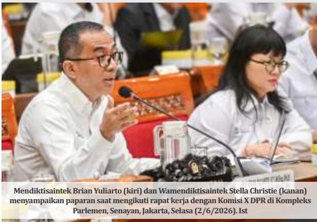
Mendiktisaintek Brian Yuliarto (kiri) dan Wamendiktisaintek Stella Christie (kanan) menyampaikan paparan saat mengikuti rapat kerja dengan Komisi X DPR di Kompleks Parlemen, Senayan, Jakarta, Selasa (2/6/2026).

M enteri Pendidikan Tinggi, Sains, dan Teknologi Brian Yuliarto mengungkap identitas empat orang yang diduga terlibat dalam skandal pemalsuan riset yang dipresentasikan pada