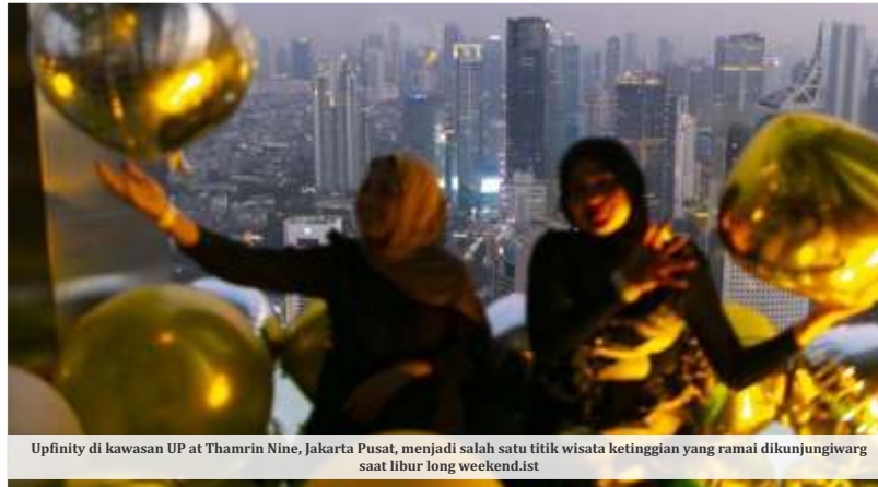
Upfinty di kawasan UP at Thamrin Nine, Jakarta Pusat, menjadi salah satu titik wisata ketinggian yang ramai dikunjungi warga saat libur long weekend.ist

Bank-bank raksasa lainnya juga mengerek tipis batas atas mereka mendekati angka psikologis tersebut. PT Bank Central Asia Tbk (BBCA) menetapkan kurs e-Rate di posisi beli