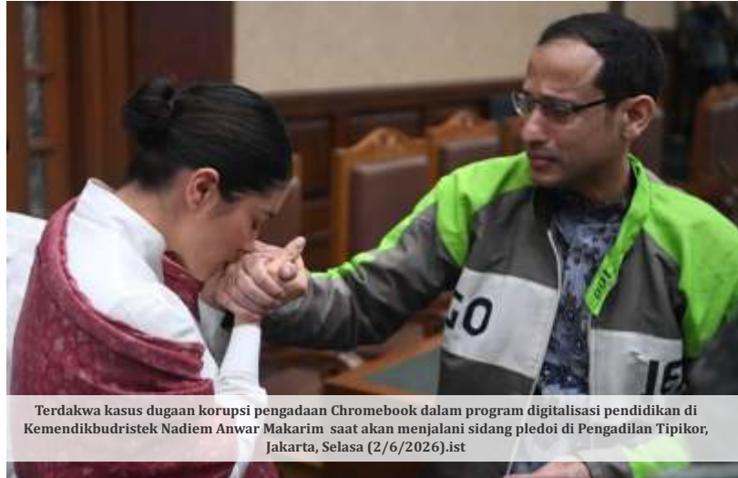
Terdakwa kasus dugaan korupsi pengadaan Chromebook dalam program digitalisasi pendidikan di Kemendikbudristek Nadiem Anwar Makarim saat akan menjalani sidang pleidoi di Pengadilan Tipikor, Jakarta, Selasa (2/6/2026).

"Setelah 5 bulan bersidang, tidak ada satu pun bukti bahwa saya menerima keuntungan, baik uang maupun saham, yang berkaitan dengan pengadaan Chromebook. Tidak ada laporan CPATK saya menerima sepeser pun uang atau saham dari kementerian, vendor