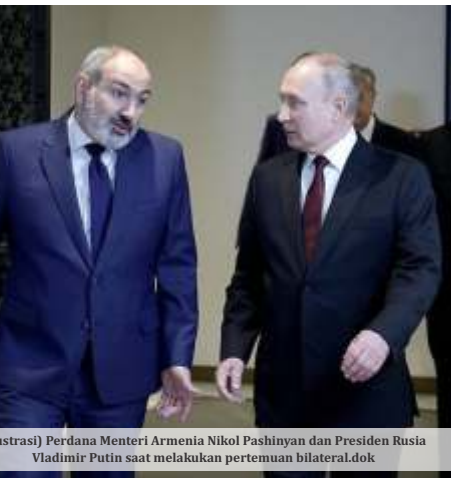
(Ilustrasi) Perdana Menteri Armenia Nikol Pashinyan dan Presiden Rusia Vladimir Putin saat melakukan pertemuan bilateral.dok

Peringatan tersebut muncul setelah serangan terhadap sebuah asrama di wilayah Luhansk yang dikuasai Rusia menewaskan 21 orang. Moskow menuduh Ukraina berada di balik serangan tersebut, namun Kyiv membantah tuduhan itu. (gus,ist,dtc/dya)