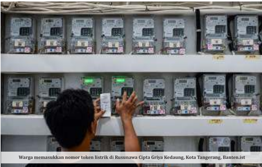
Warga memasukkan nomor token listrik di Rusunawa Cipta Griya Kedaung, Kota Tangerang, Banten.ist