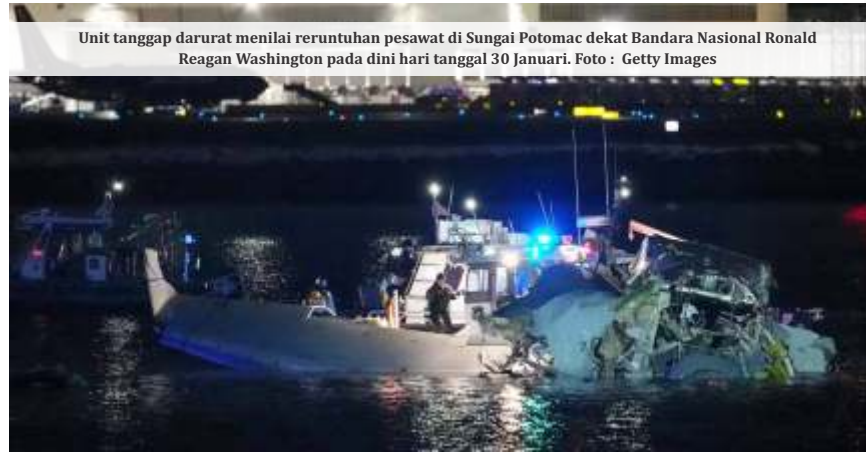
Unit tanggap darurat menilai reruntuhan pesawat di Sungai Potomac dekat Bandara Nasional Ronald Reagan Washington pada dini hari tanggal 30 Januari.

Rekaman kontrol lalu lintas udara tampaknya menangkap upaya