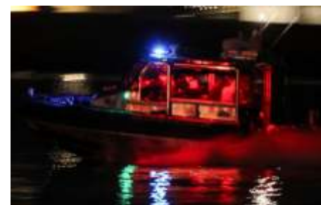
Petugas tanggap darurat bekerja di dekat lokasi kecelakaan setelah penerbangan American Eagle 5342 bertabrakan dengan helikopter Black Hawk saat mendekati Bandara Nasional Reagan Washington dan jatuh ke Sungai Potomac, di luar Washington, AS (30/1/2025).

"Kami bekerja sama dengan Dewan Keselamatan Transportasi Nasional dalam menyelidikannya dan akan terus memberikan semua informasi yang kami bisa," kata CEO American Airlines Robert Isom. (Reuters,Sputnik,ist/nei)