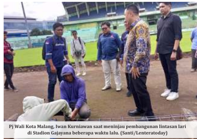
Pj Wali Kota Malang, Iwan Kurniawan saat meninjau pembangunan lintasan lari di Stadion Gajayana beberapa waktu lalu.

memfokuskan pada potensi dampak ekonomi dari penyelenggaraan Porprov di Kota Malang. Ia optimis, menjadi tuan rumah ajang olahraga terbesar di Jawa Timur ini akan memberikan efek ganda bagi Pendapatan Asli Daerah (PAD).