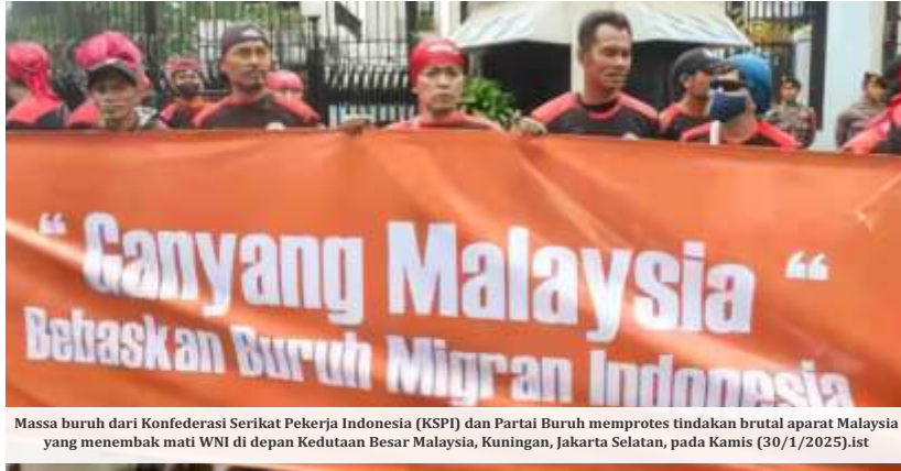
Massa buruh dari Konfederasi Serikat Pekerja Indonesia (KSPI) dan Partai Buruh memprotes tindakan brutal aparat Malaysia yang menembak mati WNI di depan Kedutaan Besar Malaysia, Kuningan, Jakarta Selatan, pada Kamis (30/1/2025).ist

Dia mengatakan bahwa pekerja migran Indonesia mampu menghasilkan devisa lebih dari Rp250 triliun. Namun selain meningkatkan