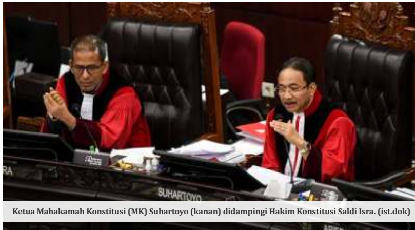
Ketua Mahkamah Konstitusi (MK) Suhartoyo (kanan) didampingi Hakim Konstitusi Saldi Isra.

Total perkara sengketa pilkada atau juga dikenal dengan istilah perselisihan hasil pemilihan umum gubernur, bupati, dan wali kota (PHP