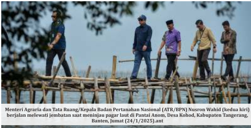
Menteri Agraria dan Tata Ruang/Kepala Badan Pertanahan Nasional (ATR/BPN) Nusron Wahid (kedua kiri) berjalan melewati jembatan saat meninjau pagar laut di Pantai Anom, Desa Kohod, Kabupaten Tangerang, Banten, Jumat (24/1/2025).ant

JAKARTA -Menteri ATR/BPN Nusron Wahid mengatakan berdasarkan hasil investigasi dan audit yang dilakukan terhadap kasus pagar laut di Tangerang, pihaknya memecat 6 pejabat daerah yang berwenang.