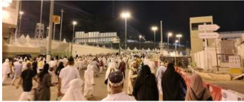
(Ilustrasi) Jamaah Indonesia wajib mendapatkan vaksinasi Meningitis dan Polio.

Jika vaksin IPV tidak tersedia, vaksin oral polio satu dosis masih dapat diterima sebagai