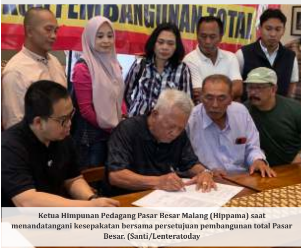
Ketua Himpunan Pedagang Pasar Besar Malang (Hippama) saat menandatangani kesepakatan bersama persetujuan pembangunan total Pasar Besar. (Santi/Lenteratoday)

MALANG - Rencana pembangunan kembali Pasar Besar Malang (PBM) terus bergulir, dengan mayoritas pedagang menyatakan persetujuannya terhadap rencana pembongkaran total. Namun, sekitar 15 persen diantaranya ternyata belum menyepakati metode revitalisasi tersebut.