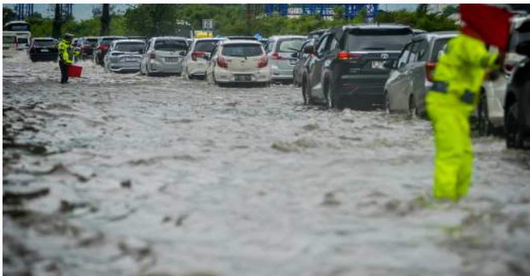
Sejumlah polisi mengatur lalu lintas kendaraan yang tersendat akibat banjir di Jalan Tol Sedyatmo, Cengkareng, Jakarta, Rabu (29/1/2025).

Dalam Proyeksi Perubahan Iklim Indonesia tahun 2020-2030 yang diberikannya, di masa mendatang, curah hujan pada musim kemarau akan semakin berkurang sampai 20%. Musim kemarau akan terasa lebih