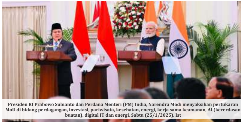
Presiden RI Prabowo Subianto dan Perdana Menteri (PM) India, Narendra Modi menyaksikan pertukaran MoU di bidang perdagangan, investasi, pariwisata, kesehatan, energi, kerja sama keamanan, AI (kecerdasan buatan), digital IT dan energi, Sabtu (25/1/2025). Ist

Adapun di regional Eropa, IMF memperkirakan pertumbuhan ekonomi akan meningkat, namun dengan laju yang bertahap. Hal ini disebabkan adanya sentimen berupa