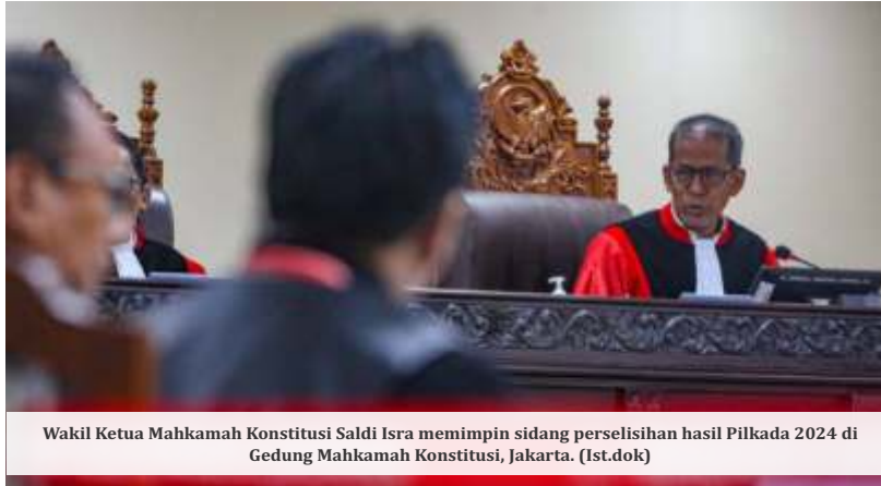
Wakil Ketua Mahkamah Konstitusi Saldi Isra memimpin sidang perselisihan hasil Pilkada 2024 di Gedung Mahkamah Konstitusi, Jakarta.

"Ketika pemerintah dan DPR sangat terburu-buru untuk melakukan pelantikan maka tentu ini menimbulkan tanda tanya, ada kepentingan apa sampai mengorbankan kepatuhan terhadap hukum yang seharusnya putusan MK dihormati dan ditindaklanjuti. Jangan sampai ada tafsir yang logical fallacy dengan sengaja dibuat untuk memuluskan rencana tertentu. Pemerintah juga bukan hanya mengingkari putusan MK tetapi keputusan yang sudah dibuatnya sendiri terkait dengan periodisasi masa jabatan kepala