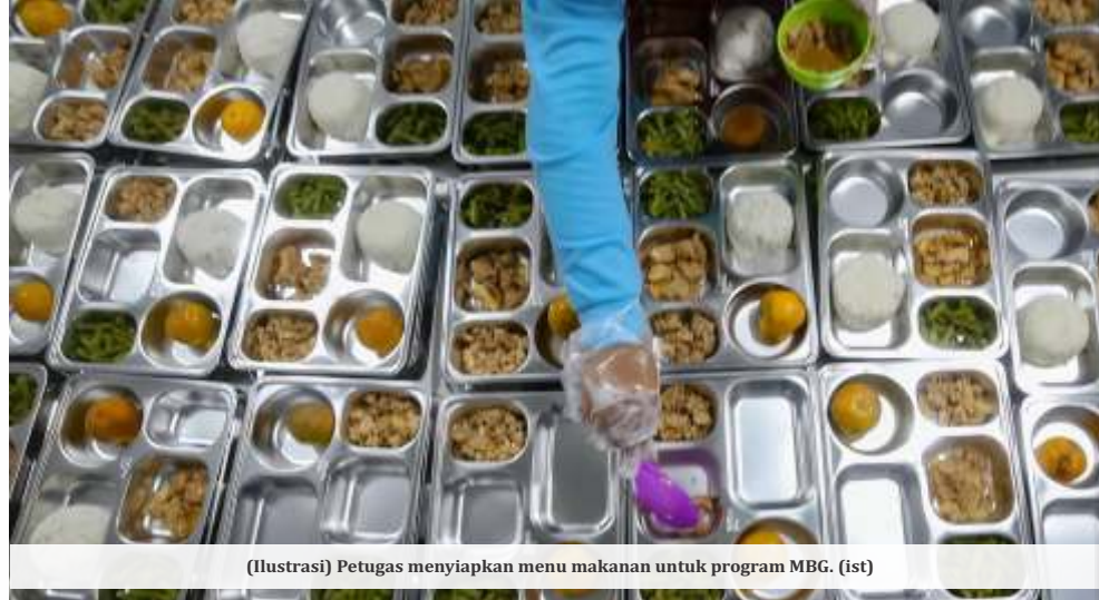
(Ilustrasi) Petugas menyiapkan menu makanan untuk program MBG. (ist)

Wacana serangga berpeluang menjadi menu alternatif makan bergizi gratis pertama kali disampaikan oleh Kepala BGN Dadan Hindayana. Dia menyatakan ada kemungkinan seporsi menu makan bergizi gratis bisa menggunakan serangga yang dapat dikonsumsi. Sebab, kata dia, beberapa serangga