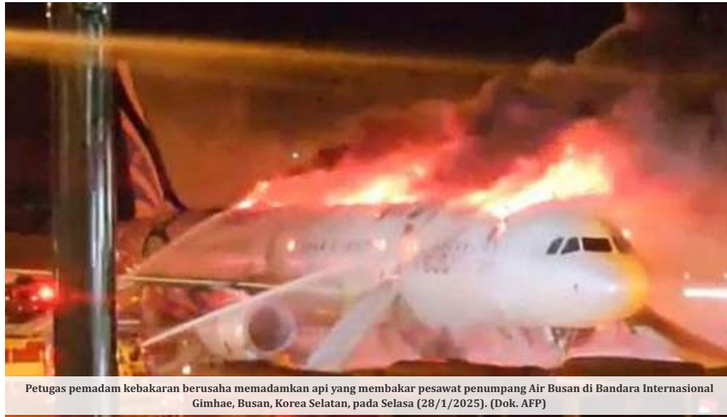
Petugas pemadam kebakaran berusaha memadamkan api yang membakar pesawat penumpang Air Busan di Bandara Internasional Gimhae, Busan, Korea Selatan, pada Selasa (28/1/2025).

Pesawat yang terbakar itu diketahui Air Busan dengan jenis Airbus A321. Pesawat tersebut dijadwalkan terbang ke Hongkong dari Bandara Internasional Gimhae, Korsel,